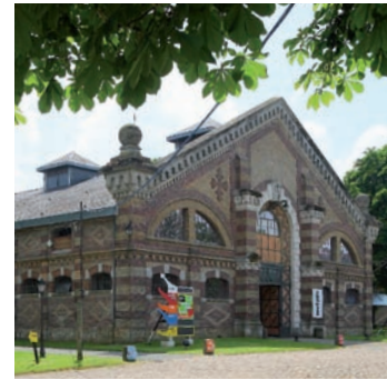
Ferme du Buisson