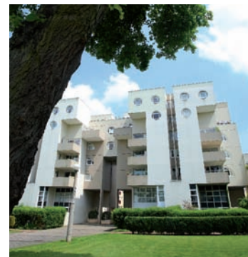
Immeubles Vasconi