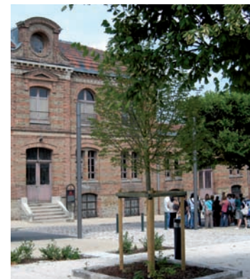
Les réfectoires Menier

→ Service d'animation du patrimoine, place Gaston-Menier