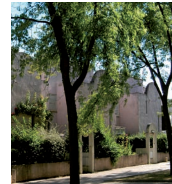
Quartier des Tilleuls

→ Place Emile-Menier, devant le monument