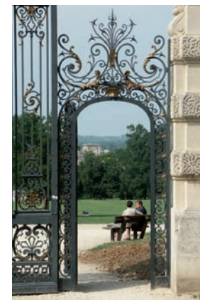
Grille d'honneur du parc de Noisiel

→ Place Gaston-Defferre, devant le joueur de flûte.