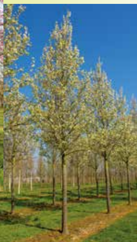
Pyrus calleryana ou Poirier de Chine.