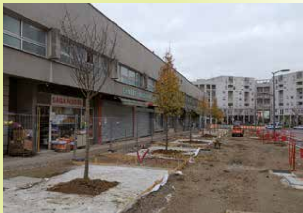
Les nouveaux arbres ont été plantés mi-novembre.