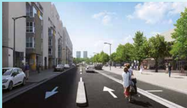
Projection du cours des Roches à la fin des travaux.

Les nouveaux arbres ont été installés sur un alignement suffisamment éloignés des façades et dans des fosses adaptées à leur développement futur, ayant une contenance de 9 m 3 de terre végétale. Deux essences différentes, plantées alternativement, ont été sélectionnées en lien avec le service espaces verts de l'Agglomération, afin de proposer une diversité paysagère et limiter les risques de propagation d'éventuelles maladies entre les sujets. Les Prunus sargentii «Charles Sargent» offriront une belle floraison rose au printemps et les Pyrus calleryana «Chanticleer» déploieront de douces fleurs blanches à la même saison. Ces deux variétés ont également comme intérêt de se parer de belles couleurs à l'automne. Elles sont adaptées au milieu urbain, avec une taille adulte raisonnable (4 à 5 m de haut) et un besoin en eau limité.