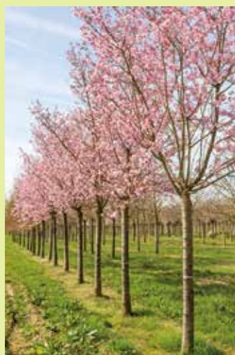
Prunus sargentii ou Cerisier du Japon.