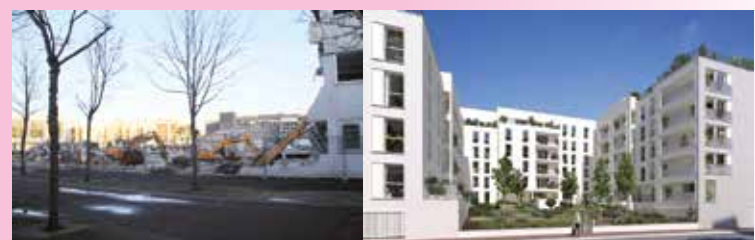
Les immeubles de la Casden démolis en 2019 et 2020 seront remplacés par des résidences en cours de construction.