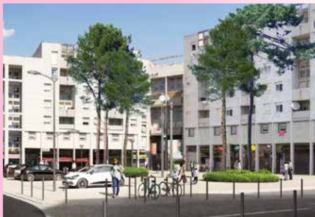
Place de l'Horloge rénovée

Début 2021 la phase du trottoir pair (entre la place Gaston-Defferre et l'allée Michel-Foucault) devrait être entièrement terminée, permettant le retour des étals du marché mi-février à leur emplacement précédent. Les travaux de réaménagement du trottoir impair pourront alors commencer. De ce côté, il est prévu que l'espace piéton soit élargi pour faciliter les déplacements et notamment l'accès aux commerces situés sous les arcades. Un revêtement en béton désactivé sera également posé au sol, dans la continuité de ce qui a déjà été réalisé au niveau du pôle gare.