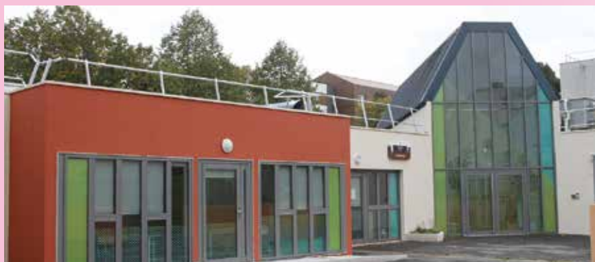
La Maison de quartier des Deux-Parcs a été réhabilitée par phases successives entre 2015 et 2019.