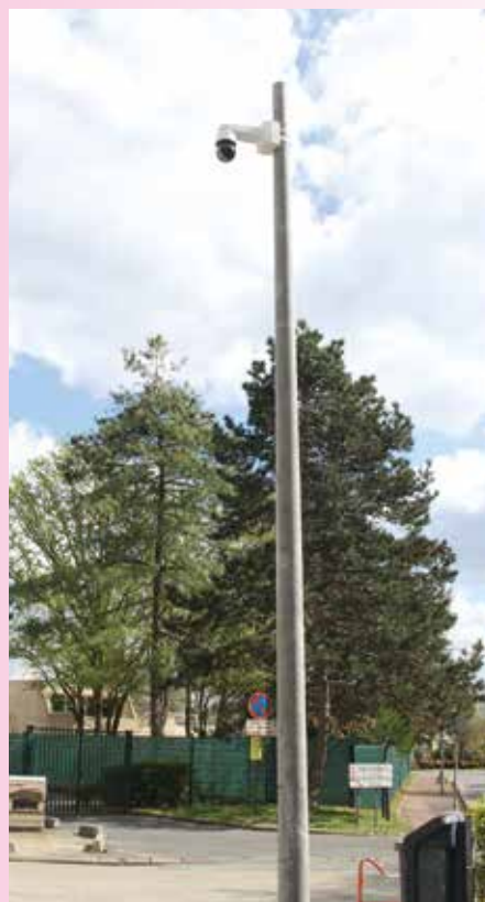
Le dispositif de vidéo protection a été déployé en 2018 et 2019.