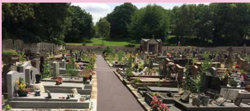
Les allées de l'ancien cimetière ont été reprises en 2018.