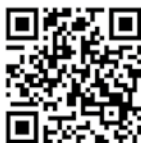
Visites cité Menier

L'achat des billets se fait uniquement sur la billetterie en ligne. Aucun billet ne sera délivré sur place.