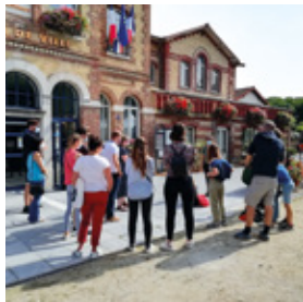
Journées du patrimoine à Noisiel