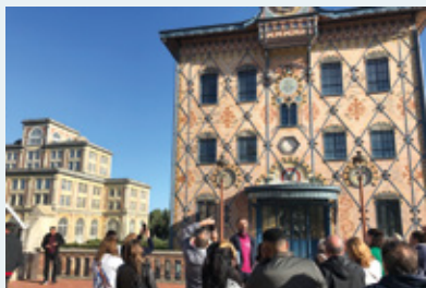
L'Ancienne chocolaterie Menier